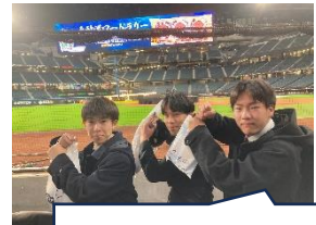
日本ハムファイターズ