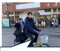
気分爽快サイクリング♪