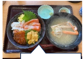
朝食の豪華海鮮丼