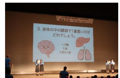
看護科ならではの、体のクイズ 勉強になりました(*~*)