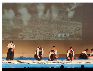
書道パフォーマンス