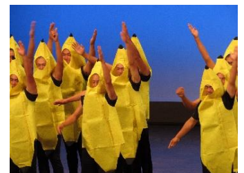
体育専攻クラスのバトナダンス