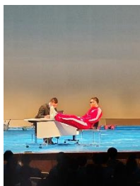
コントの腕は7口級 大爆笑でした(*~*)