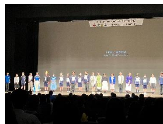
特進クラス1年の劇