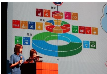
特進クラス2年 SDGsに関する発表

明豊高校は、普通科と看護科があり、普通科は体育専攻・高大連携・特進の3つのクラスに分かれています。国家試験や、部活動、大学受験、資格取得など、それぞれの目標に向かって頑張っています。ですから、明豊には、さまざまな目標、考え方、意見、知恵、ユーモアのセンスがあふれています。そのすべてを集結した明豊祭を少しご紹介します(*~*)