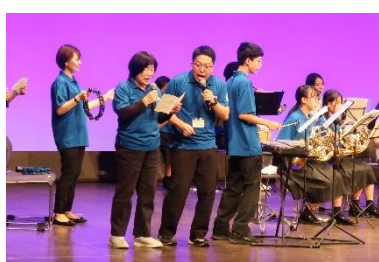
吹奏楽部も大盛り上がり♪ 校長先生も「マリーゴールド」熱唱♪