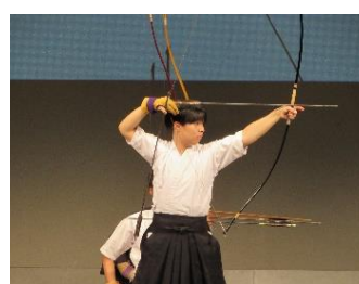
全国ベスト16に輝いた 弓道部主将の演武